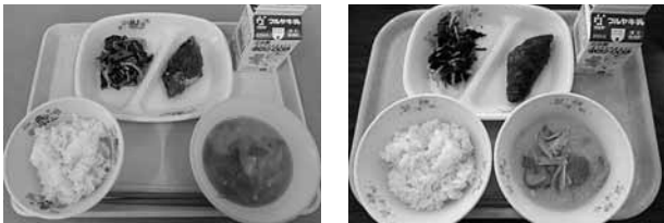
<統一献立> ごはん、さばのおろしソース 磯辺和え、豆乳入り豚汁、牛乳

1月の全国学校給食週間に、「さばのおろしソース」を取り入れた統一献立を各施設で提供した。あわせて、給食メモや放送原稿等を用意し、活用してもらい、残食率の変化を調査した。