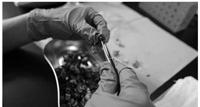
図1 イボキサゴの身の試料調製 5)

イボキサゴは東京湾東側の木更津市にある盤洲干潟に多く生息している。NPO法人 加曾利貝塚博物館友の会の主催によるイボキサゴ採取会が年1回6月に行われ、そこで採取したものを試料とした。採取したものは、流水にて洗浄し、砂やイボキサゴ以外の貝を排除したのち、 -80^{\circ}\text{C} で保存し試料調製した。生イボキサゴは解凍後、貝殻やごみなど除外し、貝殻を砕かずにピンセットを用いて身を抜いたものを試料とした（図1）。栄養成分の測定は日本食品分析センターに委託した。