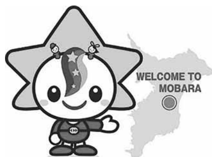
茂原市マスコットキャラクター 「モバリん」